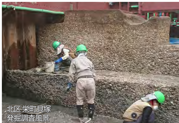
北区 栄町貝塚 発掘調査風景