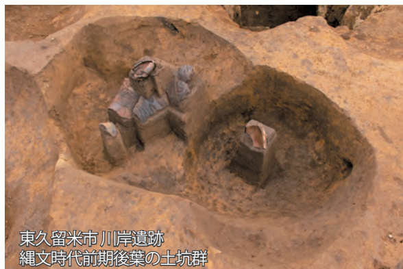
東久留米市 川岸遺跡 縄文時代前期後葉の土坑群