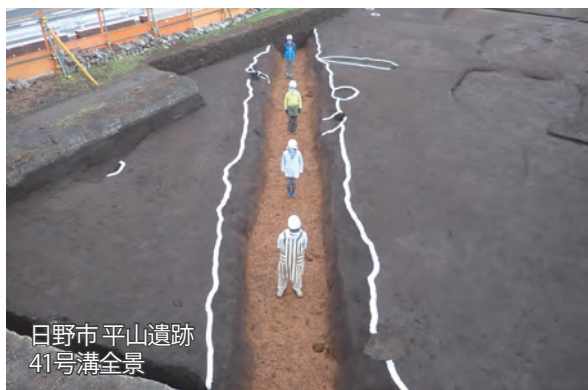
日野市 平山遺跡 41号溝全景