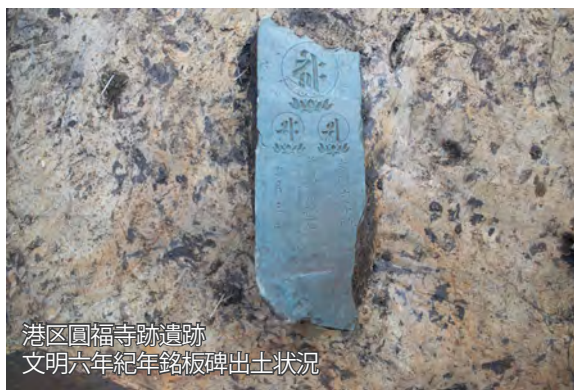
港区 圓福寺跡遺跡 文明六年紀年銘板碑出土状況