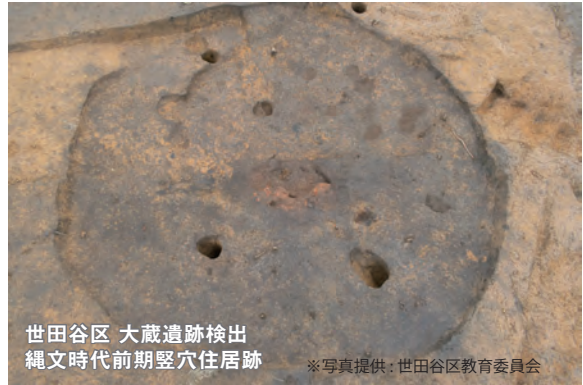
世田谷区 大蔵遺跡検出 縄文時代前期竪穴住居跡