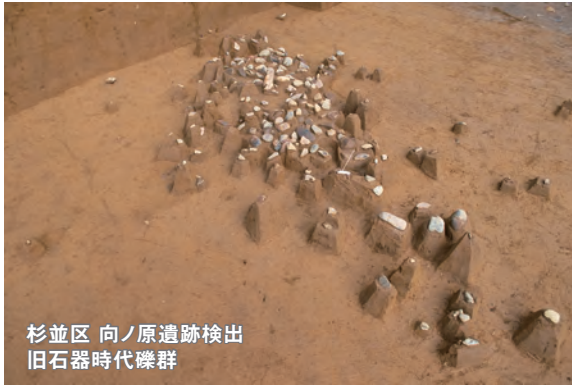
杉並区 向ノ原遺跡検出 旧石器時代礫群