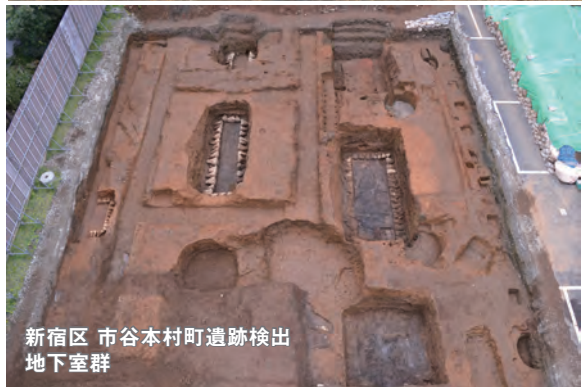
新宿区 市谷本村町遺跡検出 地下室群