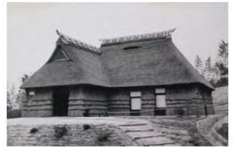
昭和35年 移築当時の信濃秋山の民家