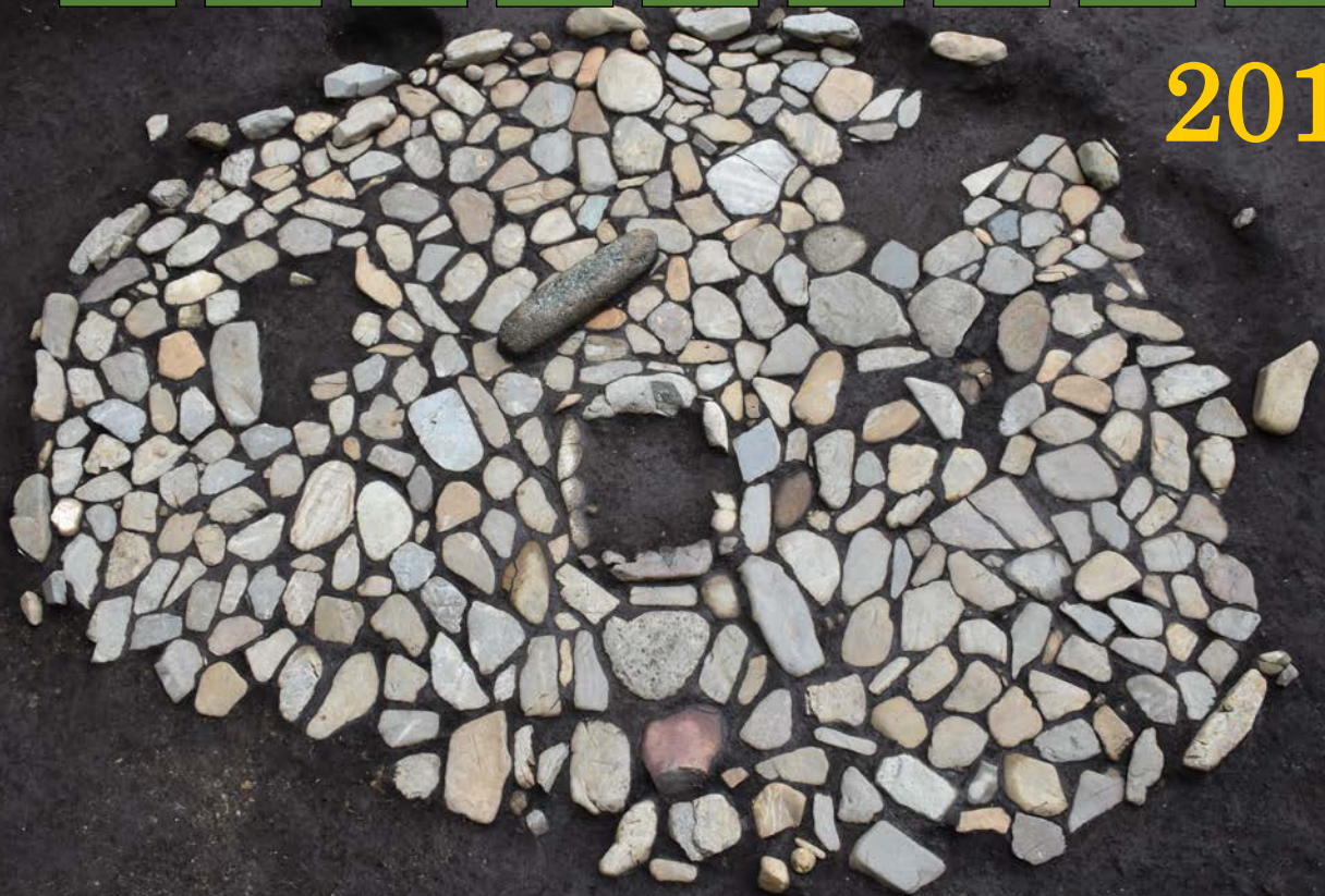
日野市川辺堀之内遺跡 敷石住居跡