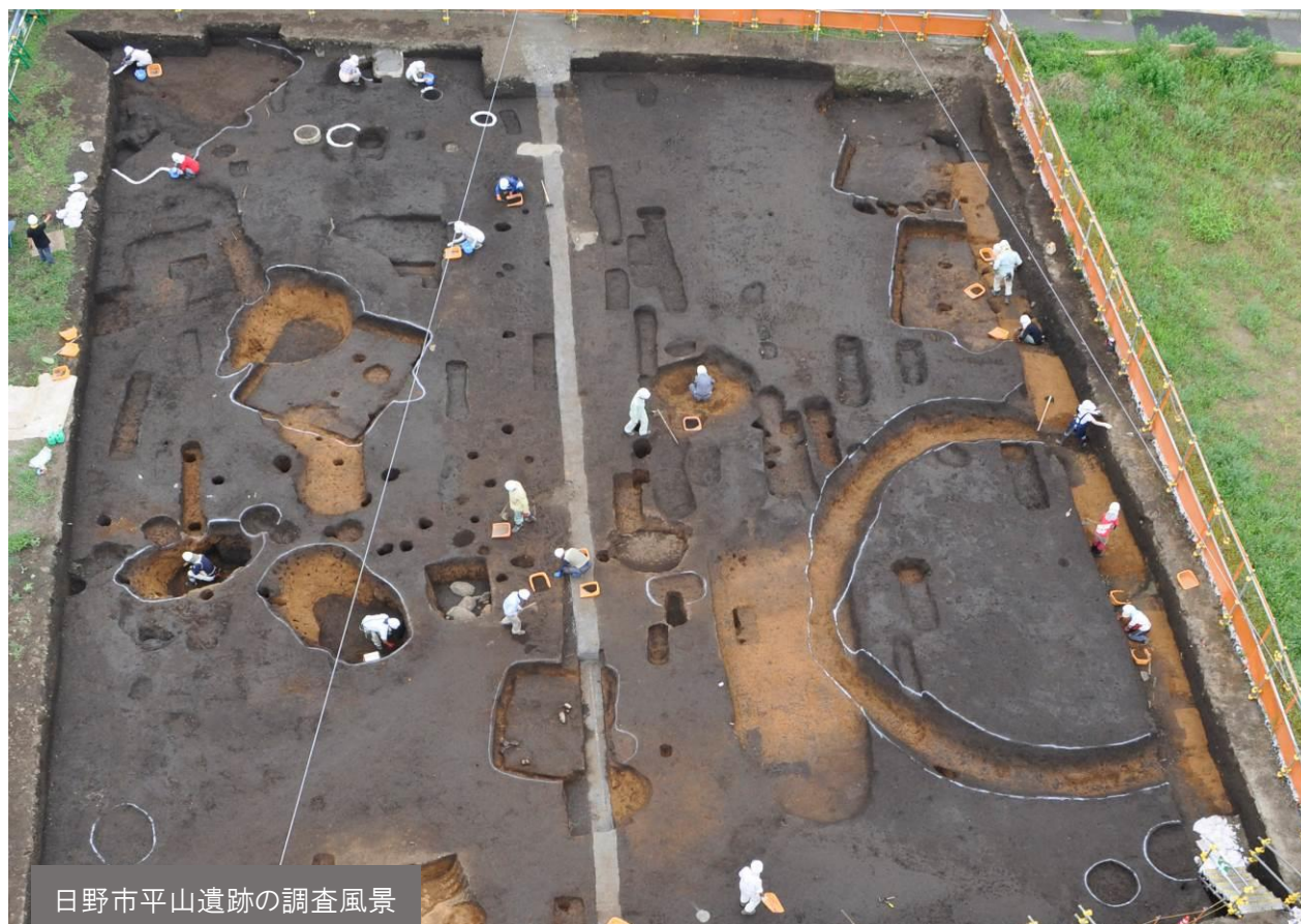
日野市平山遺跡の調査風景

平成 29 年 3 月 19 日 (日) 午後 1 時 30 分～3 時 30 分