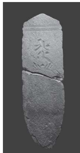
田中家墓地出土 康暦2年(1380)板碑