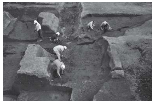
新小川町遺跡 大型溝跡