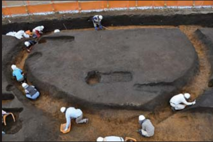
平山遺跡 1号古墳