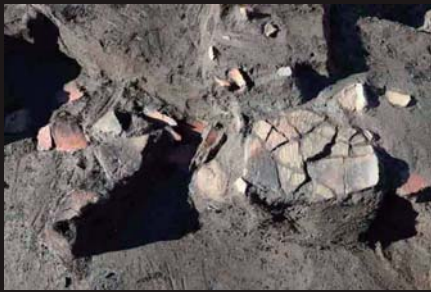
日向四谷遺跡 縄文土器