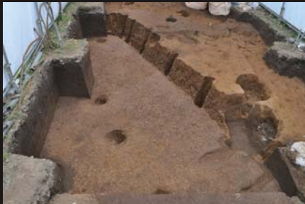
南橋遺跡 大型住居