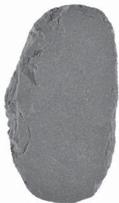
武蔵台遺跡出土 局部磨製石斧