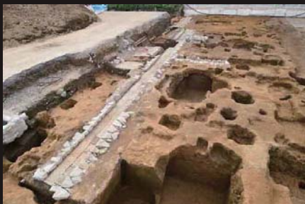
市谷本村町遺跡 石組溝と地下室群